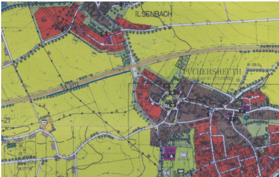
Karte FNP: Gemeinde Püchersreuth, Teilausschnitt Püchersreuth, Stand 14.03.2000

Bislang sind im Flächennutzungsplan im betroffenen Planbereich überwiegend landwirtschaftliche Flächen und im geringen Umfang Verkehrsflächen ausgewiesen.