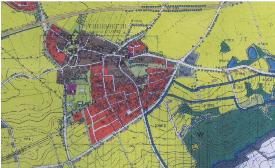
Karte FNP: Gemeinde Püchersreuth, Teilausschnitt Püchersreuth, Stand 14.03.2000

Im Flächennutzungsplan sind die Flächen des betroffenen Planbereichs bereits als Allgemeines Wohngebiet ausgewiesen.